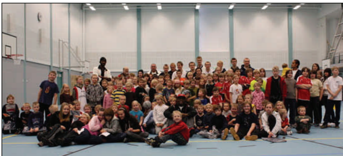
Edustusjoukkue ja juniorit Joutsenohallin hippotapahtumassa.